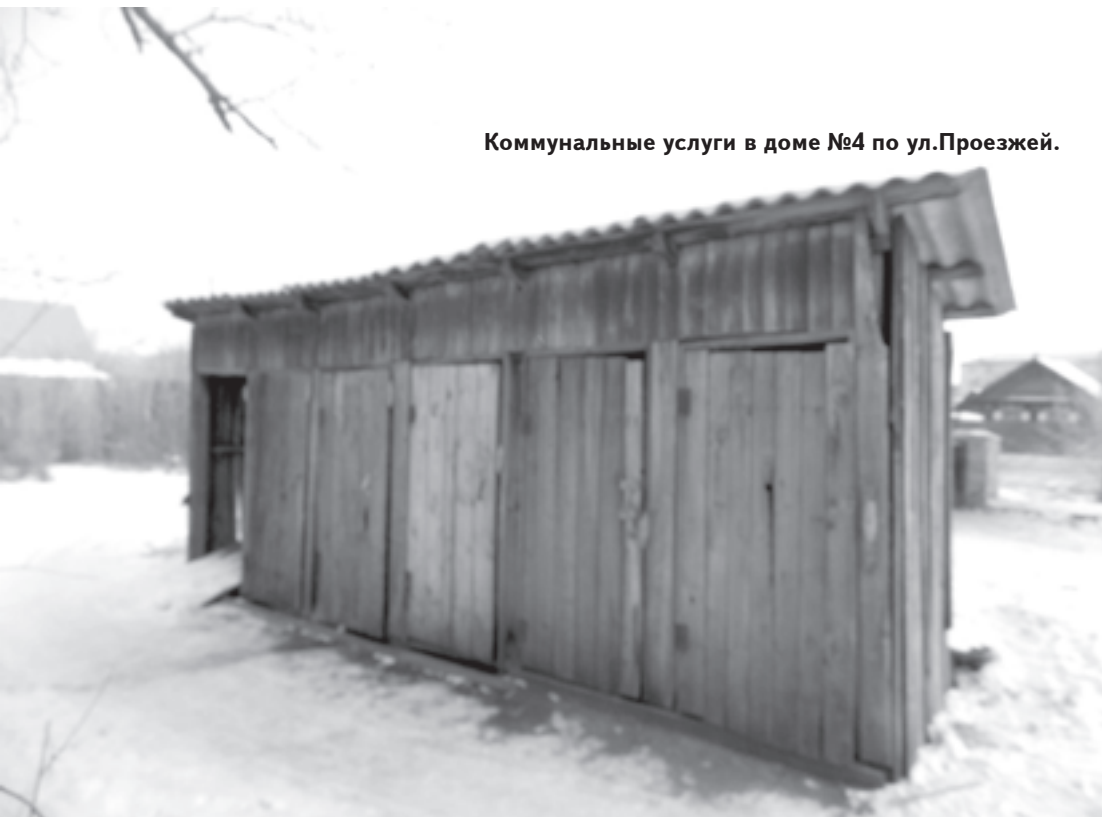
Коммунальные услуги в доме №4 по ул.Проезжей.