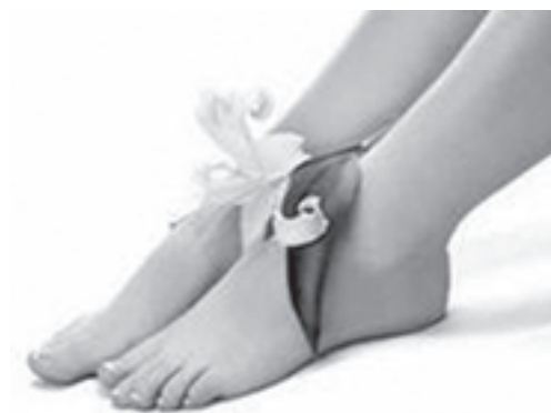
По страницам Интернета