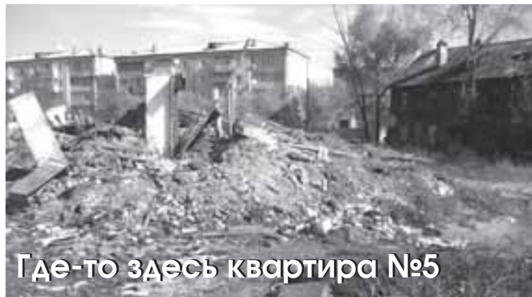
Где-то здесь квартира №5

Жильцов дома №35 по ул. Чехова переселяют в новые квартиры — таково решение суда. По дому №37 судебного решения нет, и в программу переселения из ветхого и аварийного жилья